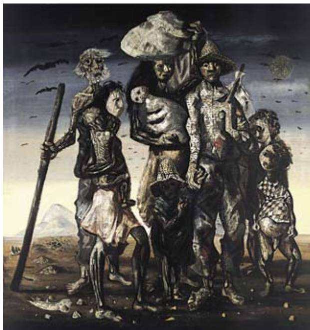
Candido Portinari, "Retirantes", 1944. Painel a óleo/tela - 190 x 180 cm