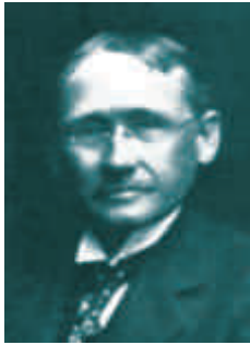
Frederick W. Taylor

gonista, pois foi quem desenvolveu novos métodos de organização racional do trabalho. Taylor criou as linhas de montagem, adaptadas à produção em massa, para o aproveitamento máximo do tempo, dos recursos humanos e materiais.