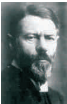
Max Weber, foi um intelectual alemão e um dos fundadores da sociologia

Relativismo - é a teoria filosófica que se baseia na relatividade do conhecimento e repudia qualquer verdade ou valor absoluto. Ela parte do pressuposto de que todo ponto de vista é válido.