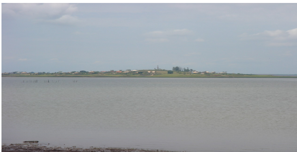
Represa Capivara.

A Represa não trouxe nenhum benefício pra cidade, a cidade teria que ter estrutura, o povo ser preparado para receber turistas, o turismo está zero. As pessoas que vêm para Primeiro de Maio nos finais de semana são pessoas que compraram chácaras, as pessoas não vêm para o turismo 7 Samira F. Valin